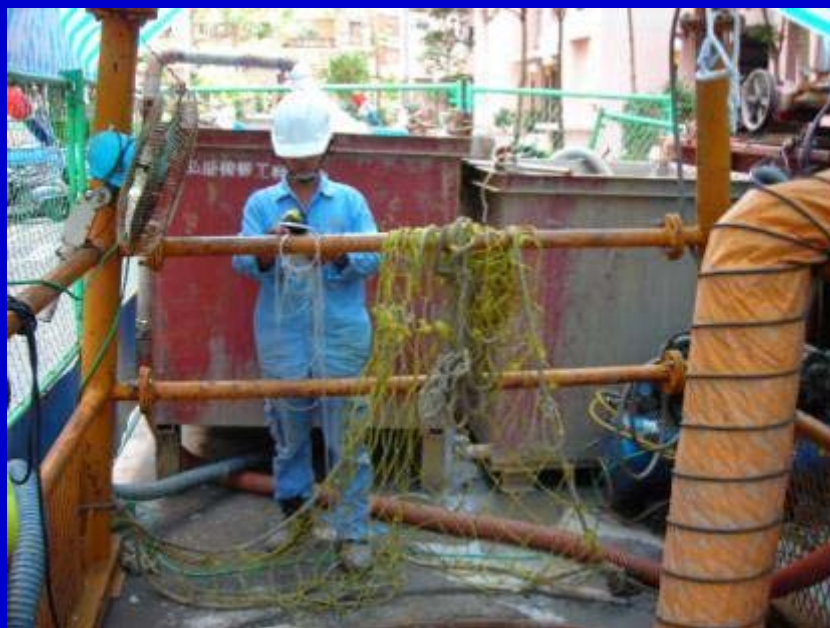
(XCc07)入坑氣體偵測 儀操作(勞安查驗)