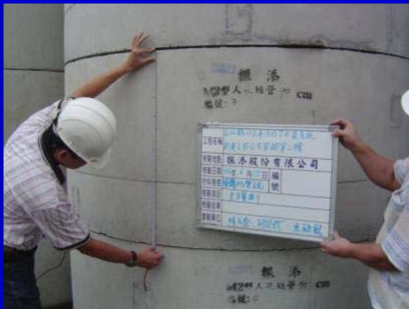
預鑄人孔尺寸量測