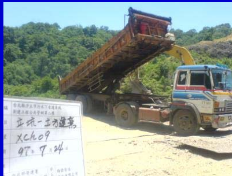
97.07.24(華園剩餘土石方處理場)