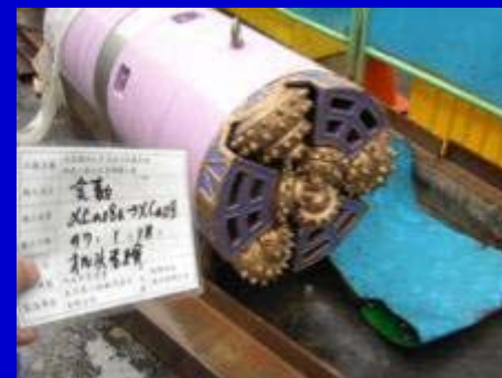
(XCa08a) \phi 400mm機頭查驗