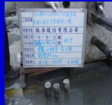
人孔鑽心取樣試體