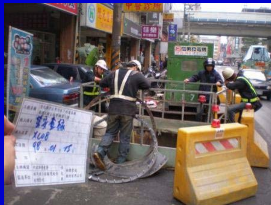
(XC08)推進坑勞安 設備檢查